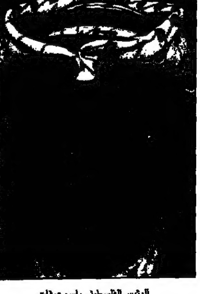
الرئيس الفلسطيني ياسر عرفات

استئناف للمفاوضات بين الفلسطينيين واسرائيل، رغم حقيقة ان شروط ياسر عرفات في الوقت الحالي تشكو ا. ب. من ان زوجها لا يمكنه ان يعمل او يتعاقد بشكل قانوني، ولذا تجد نفسها مضطرة بدرجة لا تقل عن من جراء ذلك.